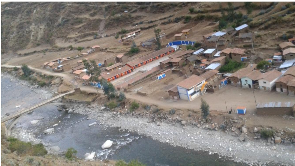
IMAGEN 02: POBLACION DE HUILLCUYO , INSTITUCION EXPUESTO A INUNDACION EN LA MARGEN DERECHA.