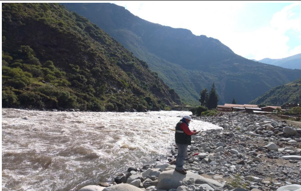
IMAGEN 03: ELCAUCE DEL RIO VELILLE SE EVIDENCIA HUELLA MAXIMA DE CRECIDA EN LA EPOCA DE LLUVIAS