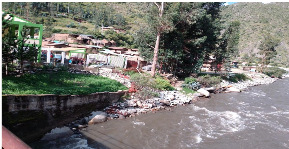
IMAGEN 01: VIVIENDAS EN LA RIBERAS DEL RIO, VULNERABLES A EROSION LATERAL Y INUNDACION